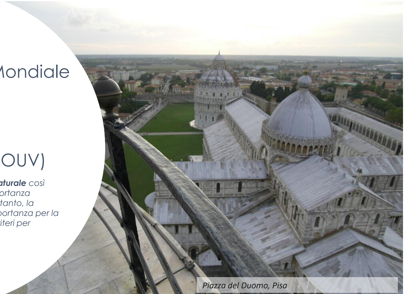
Piazza del Duomo, Pisa

Eccezionale Valore Universale significa significato culturale e/o naturale così eccezionale da trascendere i confini nazionali e da essere di importanza comune per le generazioni presenti e future di tutta l'umanità . Pertanto, la protezione permanente di questo patrimonio è della massima importanza per la comunità internazionale nel suo insieme . Il Comitato definisce i criteri per l'iscrizione dei beni nella Lista del Patrimonio Mondiale (O.G. 49).