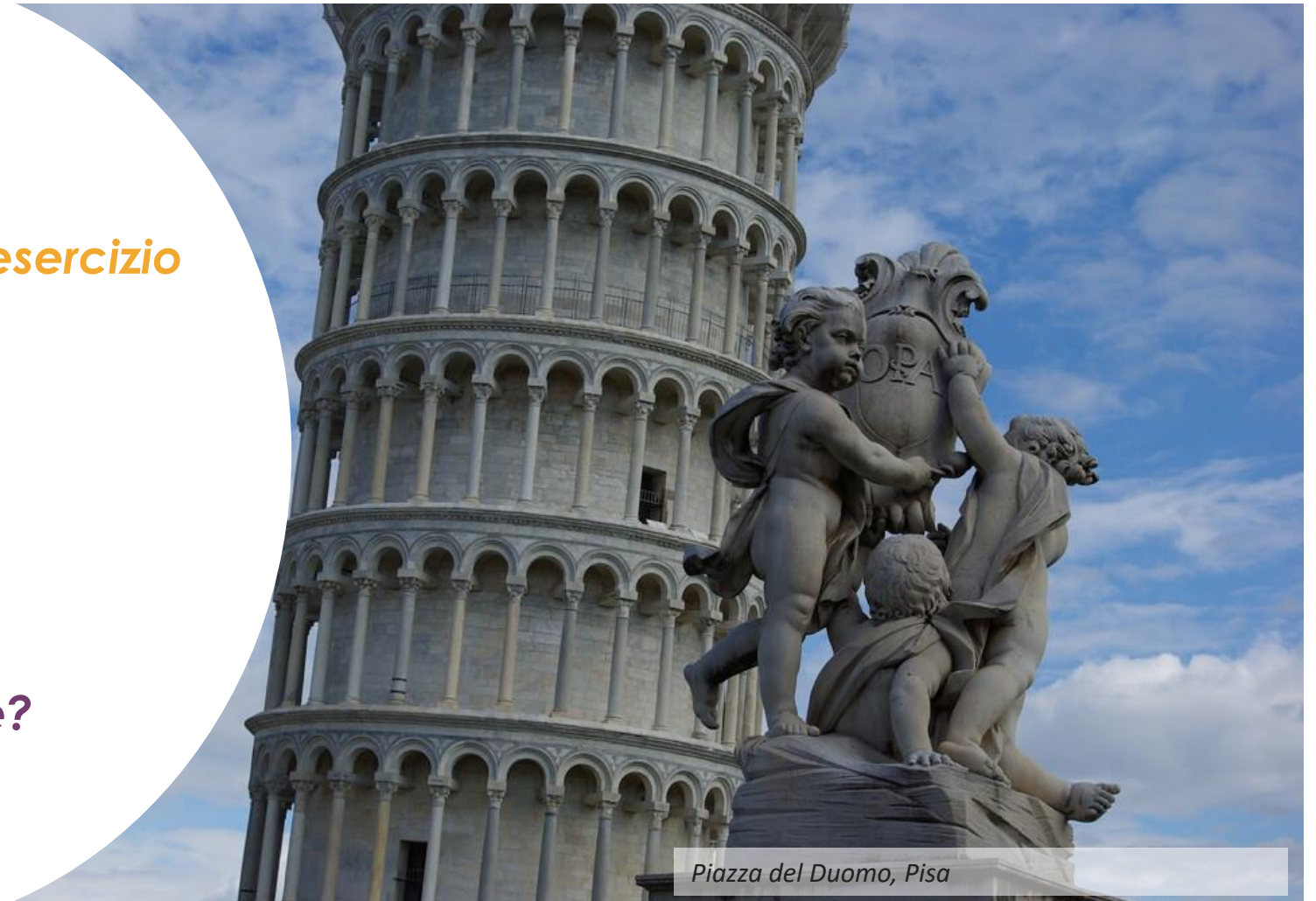
Piazza del Duomo, Pisa