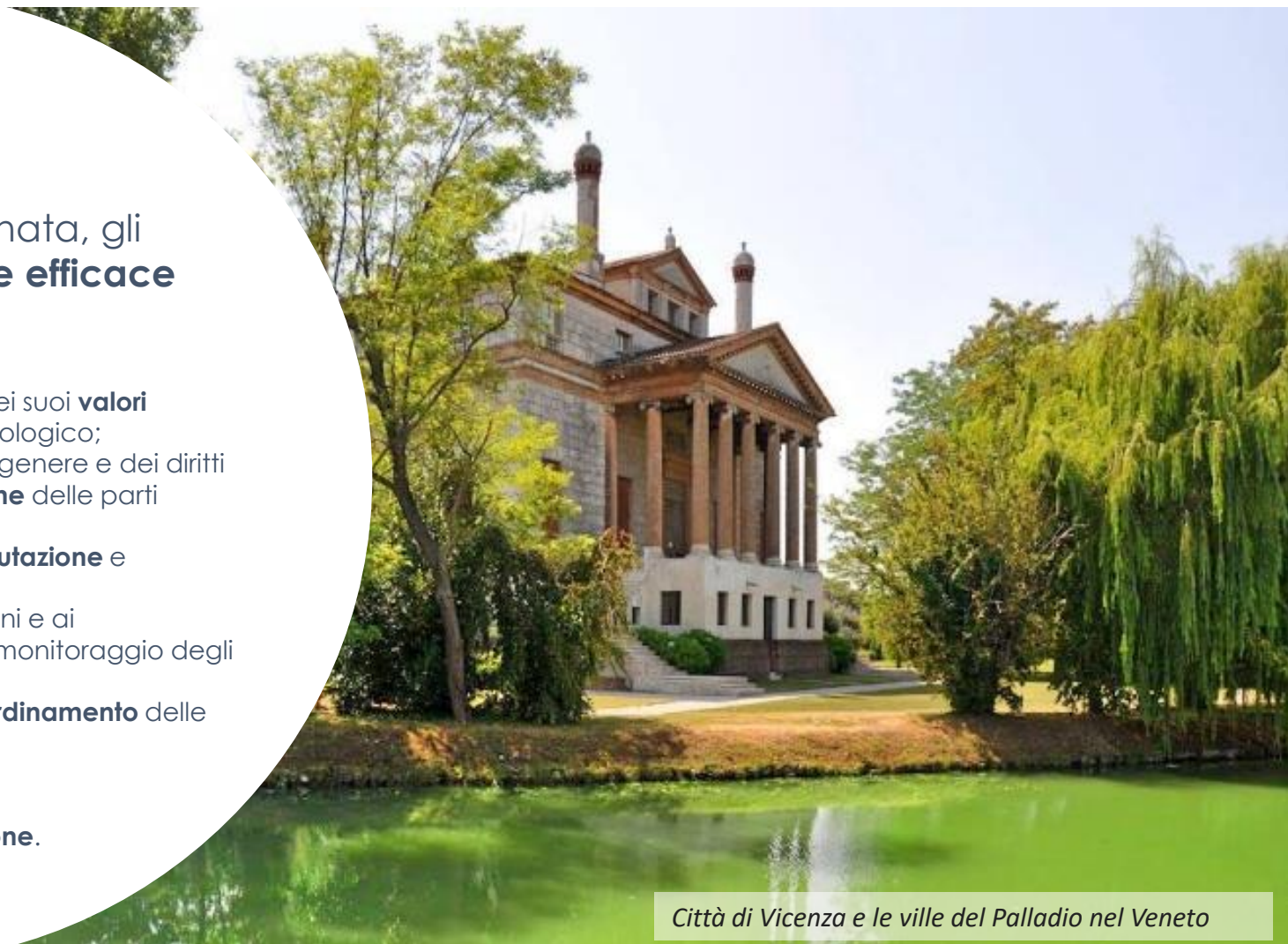
Città di Vicenza e le ville del Palladio nel Veneto