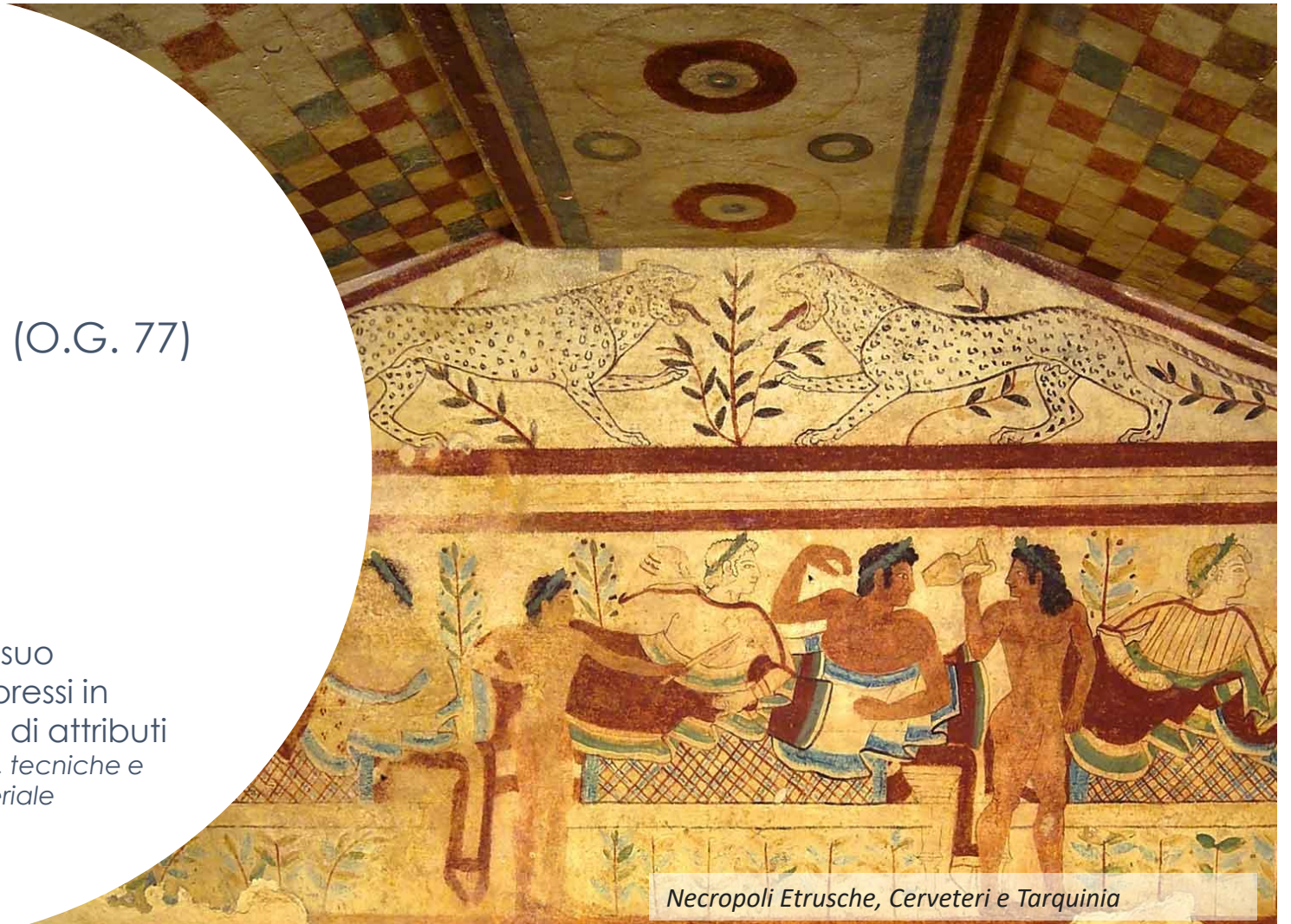
Necropoli Etrusche, Cerveteri e Tarquinia

A seconda del tipo di patrimonio culturale e del suo contesto culturale... i loro valori culturali sono espressi in modo veritiero e credibile attraverso una varietà di attributi forma e design, materiali e sostanza, uso e funzione, tradizioni, tecniche e sistemi di gestione, ubicazione e contesto, patrimonio immateriale