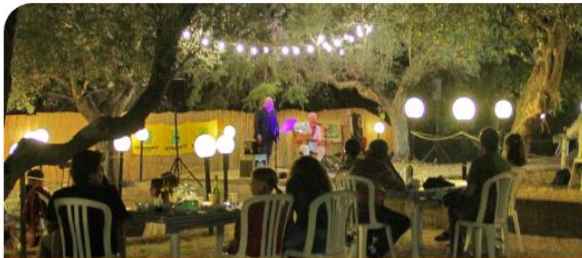
RISTORANTE PECCATI DI GOLA