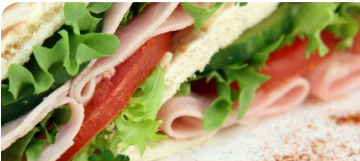
RISTOBAR DEGLI SCIENZIATI