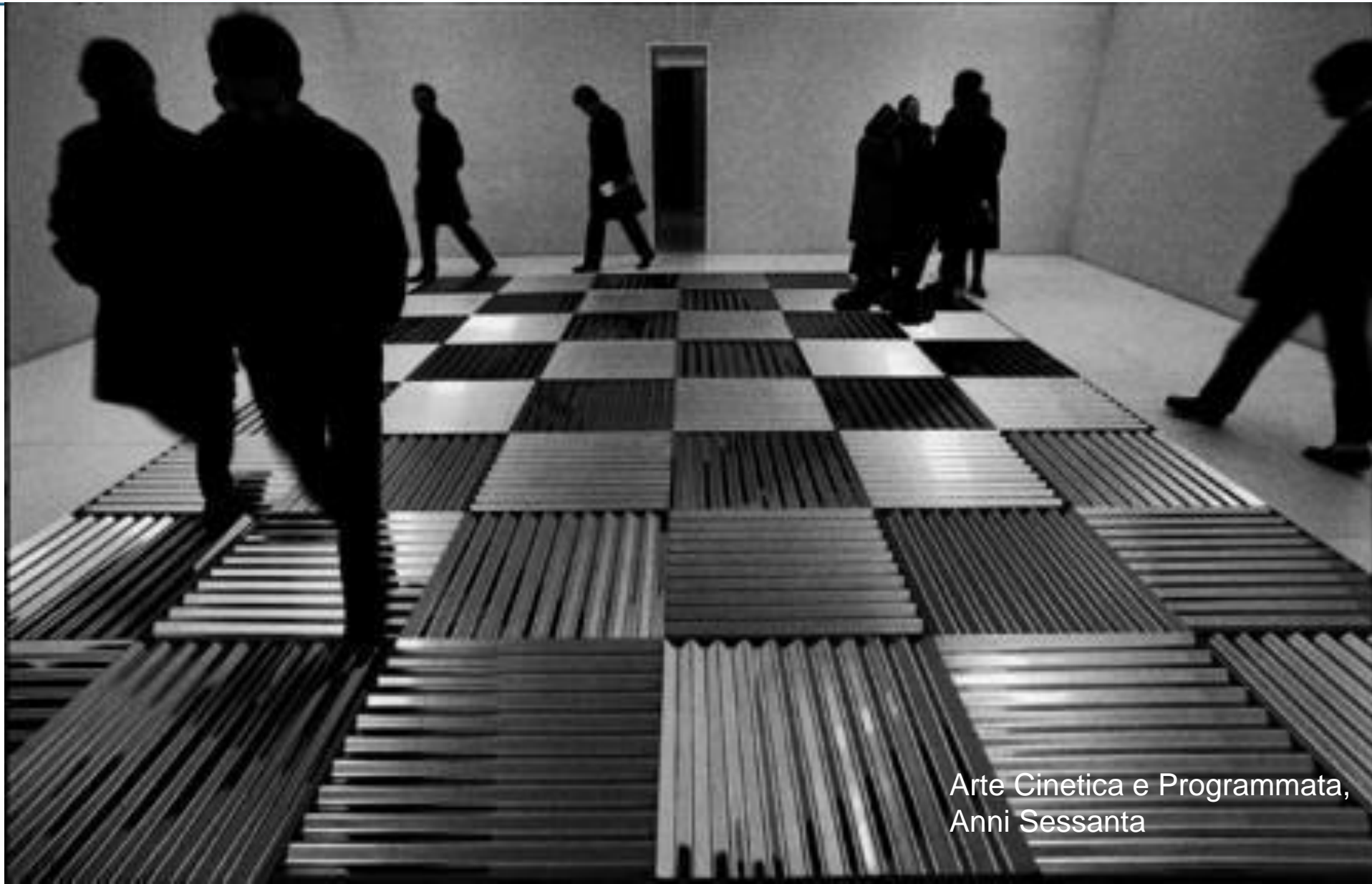
Arte Cinetica e Programmata, Anni Sessanta